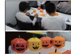
◎ ハロウィンパーティー(小学生)

アクシアでは説明会や個別面談を通じて最新の教育情報をご提供して参ります。塾の様子や成績・進路に関するご相談につきましては、個別面談で随時対応しております。いつでもお気軽にご相談ください。