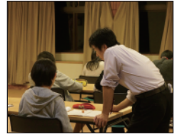
◎ 勉強宿舎 (中3生)