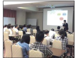
◎ 入試説明会 (中3生)